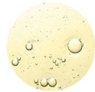
JARABES DE GLUCOSA